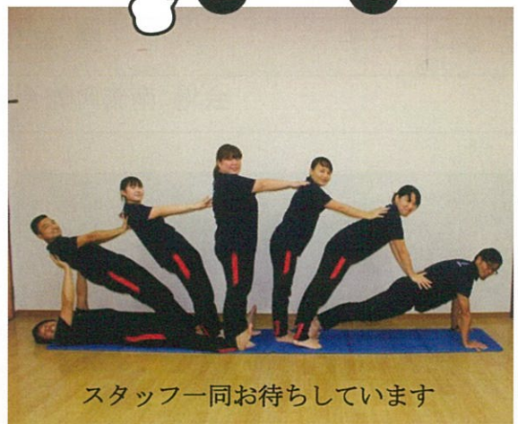
スタッフ一同お待ちしております